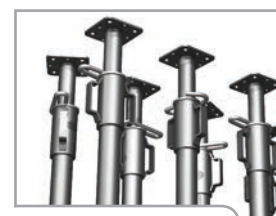
Stutten en vijzels