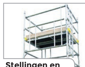
Stellingen en steigers

*Om STRATOL te verwijderen, gebruik SOLVANIX